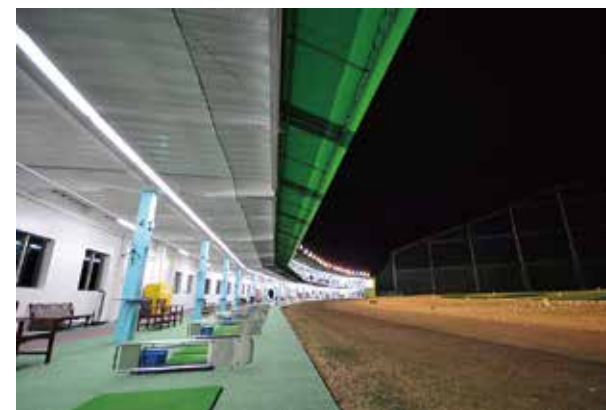
『ハミングバード』ゴルフ場