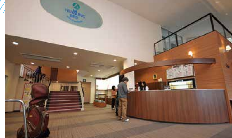
『ハミングバード』エントランス