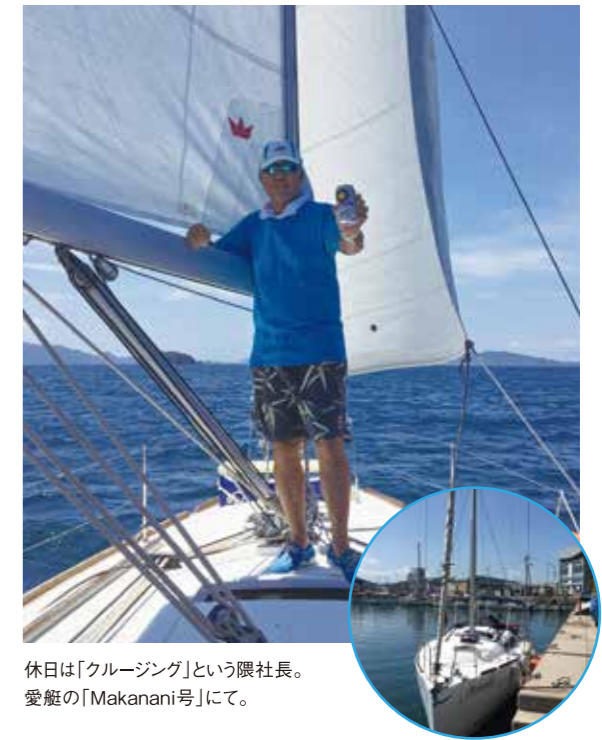
休日は「クルージング」という隈社長。愛艇の「Makanani号」にて。