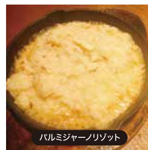
パルミジャーノリゾット