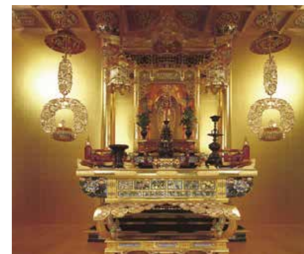
京都西本願寺様、大谷本廟新無量寿堂