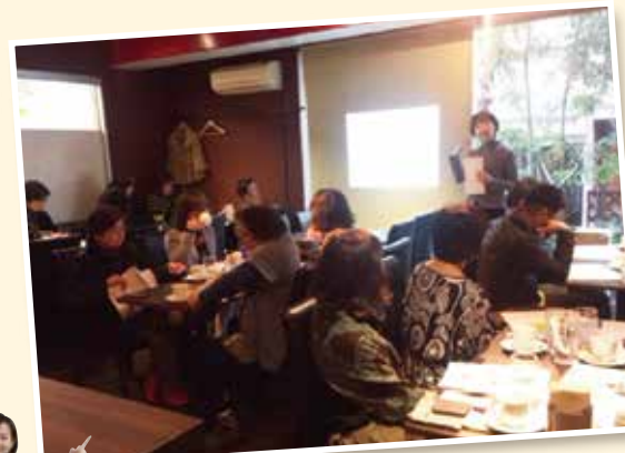
セミナー開催 風景

このセミナーは日頃の感謝の気持ちを皆様にお伝えするために今後も定期的開催いたします。随時ご案内させていただきますのでお気軽にご参加ください。