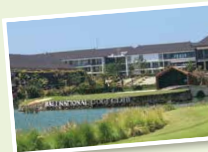
池越えのショートホール