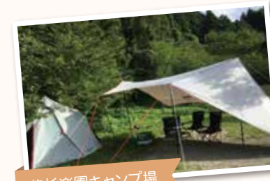
若杉楽園キャンプ場