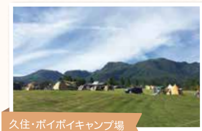
久住・ポイポイキャンプ場

道具もまだまだそろってはいませんが、少しずつお気に入りを増やしていこうと思います。