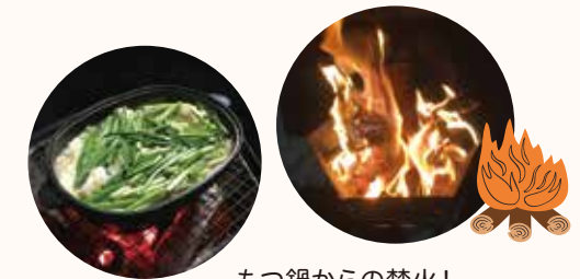
もつ鍋からの焚火!