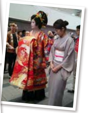
是非、秋の長崎にお出かけ下さい!