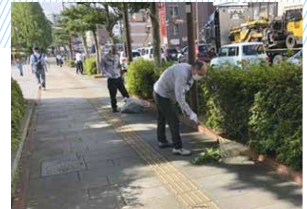
地域清掃活動のようす

このような大規模な工事を受注させて頂く事もありますが、他 の業者さんが取りたがらないような手間がかかったり儲からな い大変な工事を受注して数字を重ねていくのが弊社の得意 とする所ですね。そして、その中で試行錯誤しながら効率良く 工事を完成させて行く事にもやり甲斐を感じます。