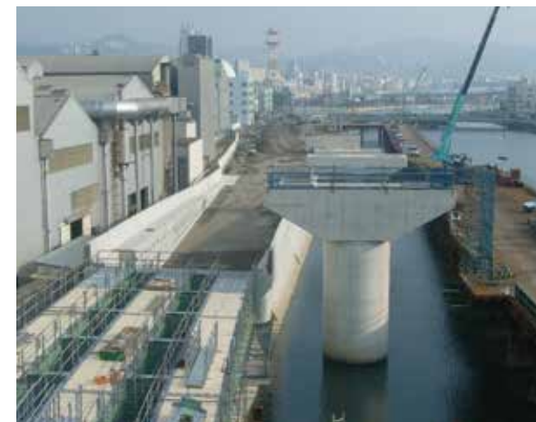
浦上川線高架橋建設工事