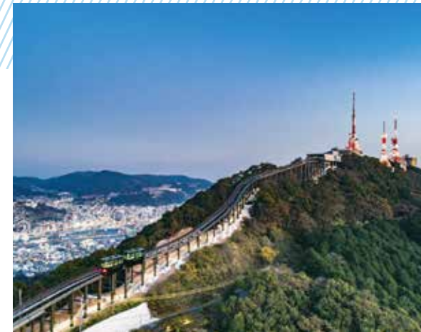
稲佐山公園斜面輸送施設整備工事

少し前と言うと稲佐山スロープカーの支柱の建設工事です とか、10年ほど前になりますが浦上川線高架橋建設工事にも 携わらせて頂きました。